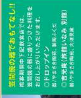
24 空閑館の湯でもなし!!