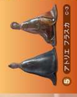
5 アトリエ フラスカ