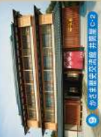
9 かまき里交流遊覧 井筒屋