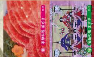
11 季節料理 新さき