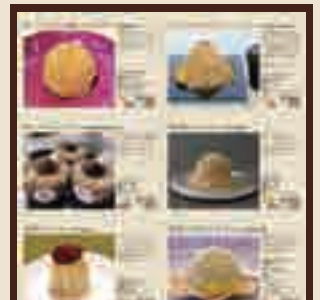
スタンプラリー台紙のイメージです。

主催・発行 儲かる笠間の栗産地づくり協議会 お問合せ 笠間市農政課 TEL 0296-77-1101 笠間市HP https://www.city.kasama.lg.jp/